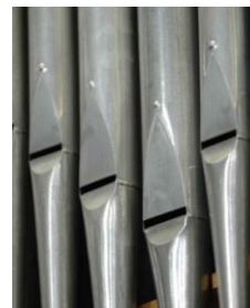
Les plus gros tuyaux