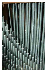
les petits tuyaux