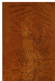
Liste des donateurs de 1992